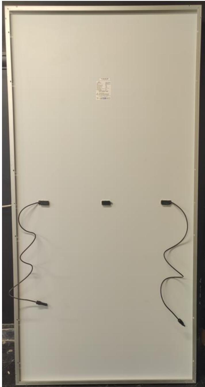
Photo 2: Rear view of module type AOX-72MHMAX 550W Foto 2: Vista da parte traseira do tipo de módulo AOX-72MHMAX 550W