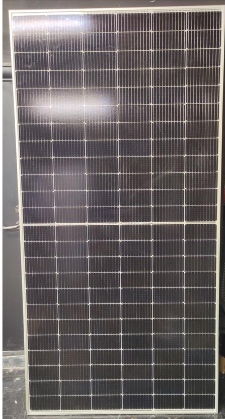
Photo 1: Front view of module type AOX-72MHMAX 550W Foto 1: Vista frontal do tipo de módulo AOX-72MHMAX 550W

Annex 1 Photos of modules Anexo 1 Fotos dos módulos